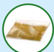
海洛因 也被称为白粉、UBAT