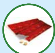
硝甲西洋 也被称为“埃利敏5号” (Erimin-5)