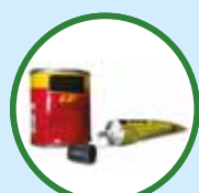
吸入剂 俗称“吸强力胶”