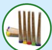
新类精神科物质 (NPS) 也被称为香料、浴盐