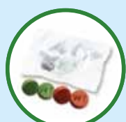
甲基苯丙胺 也被称为“毒冰”、“Ya ba”